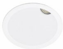
90 Blanco Técnico / Technical White / Blanc Technique