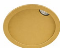
09 Oro Técnico / Technical Golden Or Technique