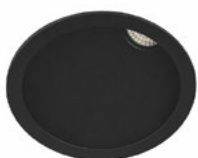
01 Negro / Black / Noir