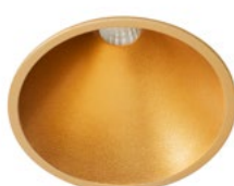
09 Oro Técnico / Technical Golden Or Technique