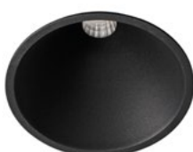
01 Negro / Black / Noir