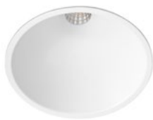
90 Blanco Técnico / Technical White / Blanc Technique